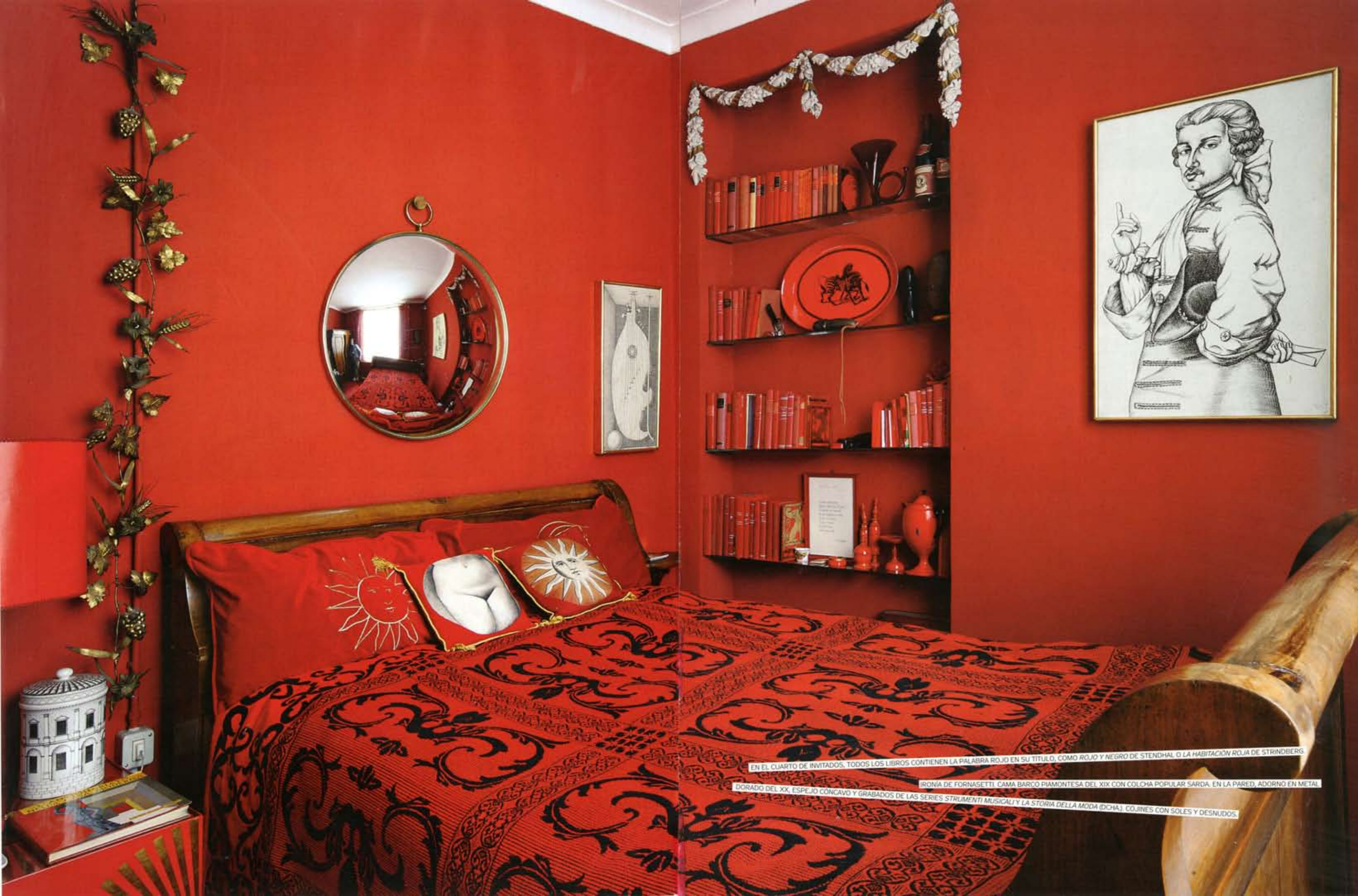
EN EL CUARTO DE INVITADOS, TODOS LOS LIBROS CONTIENEN LA PALABRA ROJO EN SU TÍTULO, COMO ROJO Y NEGRO DE STENDHAL O LA HABITACIÓN ROJA DE STRINDBERG