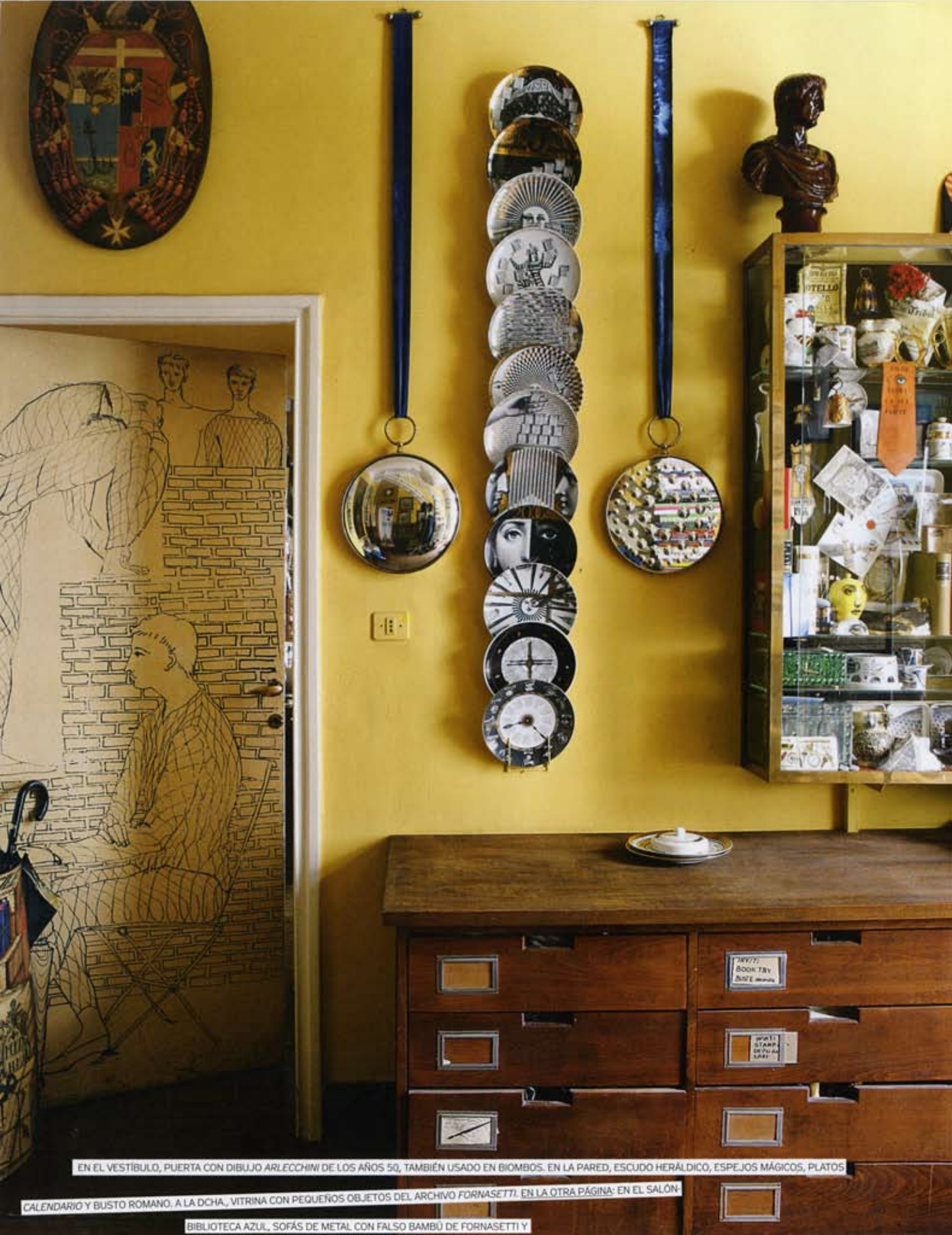
EN EL VESTIBULO, PUERTA CON DIBUJO ARLECCHINI DE LOS AÑOS 50, TAMBIÉN USADO EN BIOMBOS. EN LA PARED, ESCUDO HERÁLDICO, ESPEJOS MÁGICOS, PLATOS